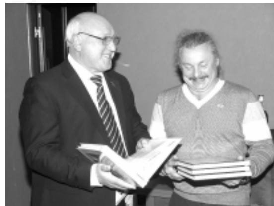
Книга - лучший подарок

российском зоо-рынке присутствует продукция, не регламентированная по качеству. Для этого при нашем содействии был открыт первый и единственный в России Технический комитет при общественной организации. Все - при институтах, а наш - при общественной организации.