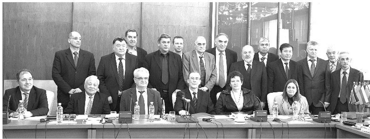
Члены КПП с вновь избранным директором ОИЯИ

– Она и так очень сильна в институте – достаточно вспомнить Бруно Максимовича Понтекерво. Но, я думаю, быть может, будет укрепляться объединение усилий ОИЯИ и других институтов, в том числе России, мира и, в частности, того института, который я сейчас возглавляю – Института ядерных исследований. Мы уже развиваем совместно многие проекты и, в частности, эксперимент с глубоководным нейтринным телескопом на озере Байкал. Думаю, что здесь у нас будет сильный толчок, такой, который обеспечит нам очень выгодные позиции в мире.